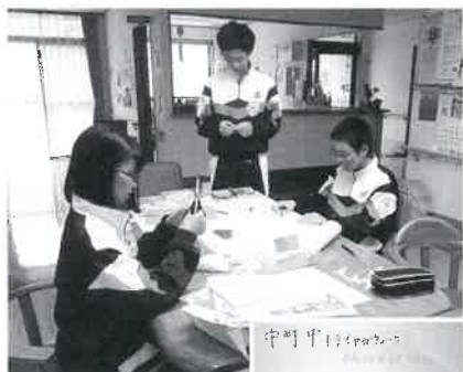
グループホームで 記念に作りました☆