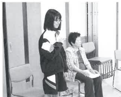
ふれあいいきいきサロンでは手話で 自己紹介をしました！

この5日間では、本当に多くの方との出会いがあったように、中学生の3人もいろいろな方に囲まれてこの多可町で生活をしているということを感じたと思います。これからも、いろんな方と出会い、あいさつやお話をしてほしいと思います。