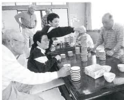
春蘭荘では高齢者の方と一緒にゲーム をしました♪