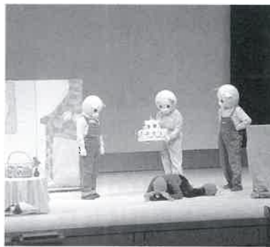
ボランティアグループ 「レーブ・セマンズ」 による人形劇☆