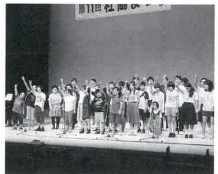
北はりま特別支援学校・ 多可高等学校有志の合唱♪