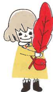
たか坊、あかはねちゃん、 ふう子と一緒に、 ハイ!ポーズ♪