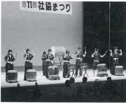
オープニングは今年も 多可高等学校の和太鼓！