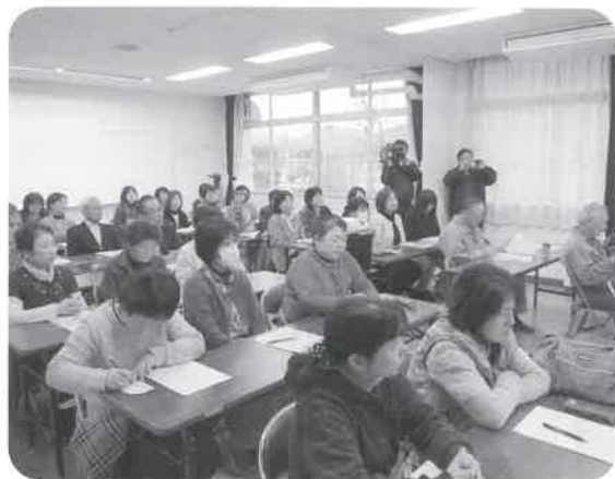
みなさんの熱心な姿が印象的でした。

講座には、ボランティア活動はできないまでも、この機会に学びたい、という方の参加も多くありました。特別支援学校でのボランティア交流という一場面だけでなく、障害のある人が普段から生活している身近な地域の中での理解や関わりも大切だということも感じてもらえたようでした。