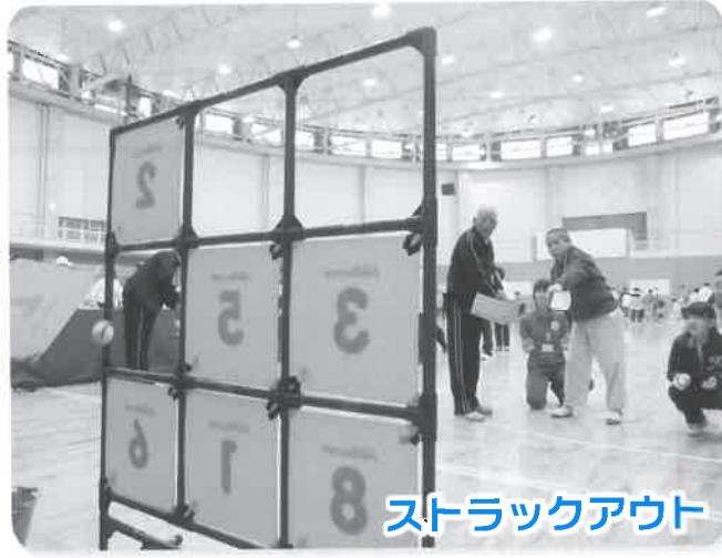
ストラックアウト