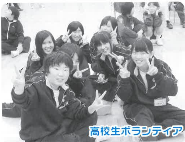
高校生ボランティア