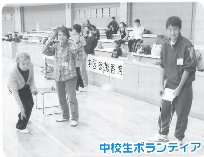
中校生ボランティア