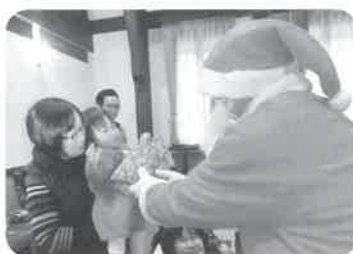
クリスマス親子コンサート