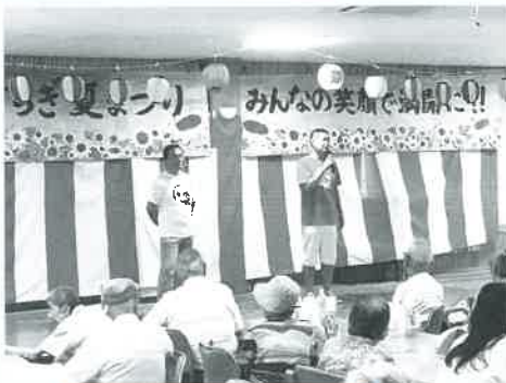
◀みんなで笑いヨガ! 播丹ケアグループさんにお世話になりました☆