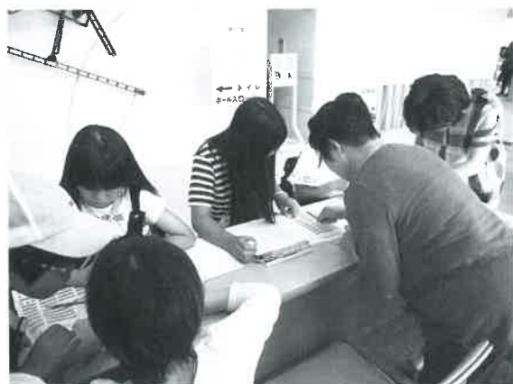
点字体験のコーナー☆ 点字を打つのは気持ちいい♪