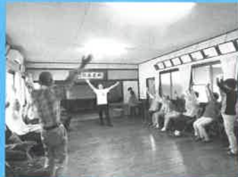
■小地域たすけあい活動 ふれあいいきいきサロン