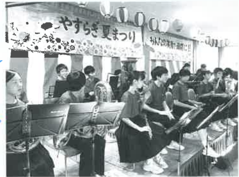
加美中学校吹奏楽部の合奏! 迫力がありました!