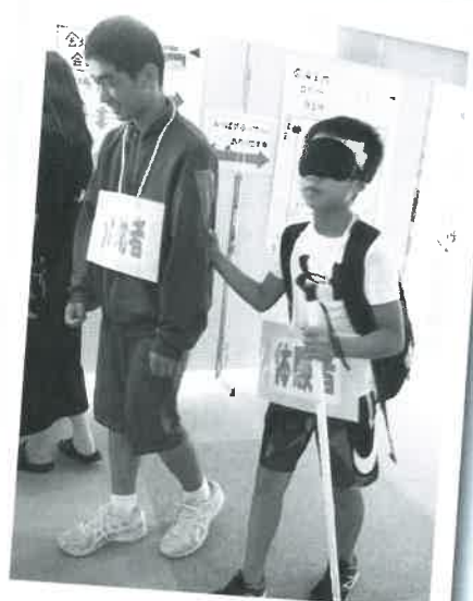
福祉体験のアイマスク体験☆ 声かけの大切さが学べます！