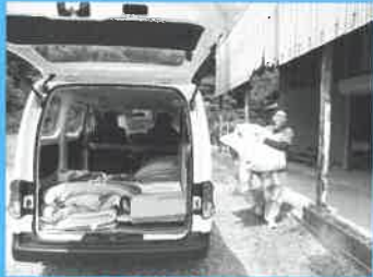
■在宅福祉サービス ふとん丸洗い事業

本年度も社協会員の加入の願いをしましてところ多くみなさまに加入いただきました。ご協力いただきました区長様をはじめ、地域のみなさま方に深く感謝申し上げます。お寄せいただきました社協会費は、共同募金や善意銀行の寄付金などとともに、多可町の地域福祉をすすめる大きな財源として、「みんなが安心して暮らせるまちづくり」の実現に向け、活用させていただきます。 今後とも社協会費の趣旨をご理解いただき、温かいご支援とご協力をお願い申し上げます。本年度の会費を以下の通り報告させていただきます。ありがとうございました。