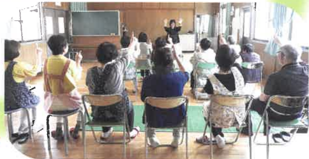
八千代区中野間 (片瀬)