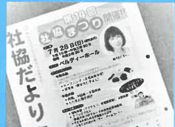
■情報・調査活動 社協だより多可の発行