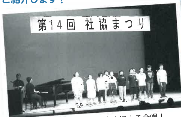
北はりま特別支援学校有志による合唱！ 会場からもよく歌声が聞こえました♪