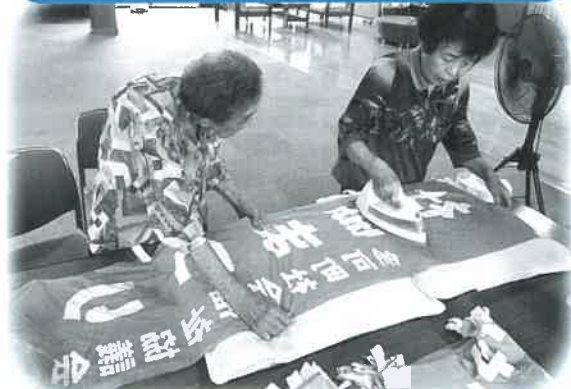
使い終わったのほりをキレイにしてくれたのは、 デイサービスセンターやすらぎの利用者さんたち！ 多くの方に支えられたまつりです☆