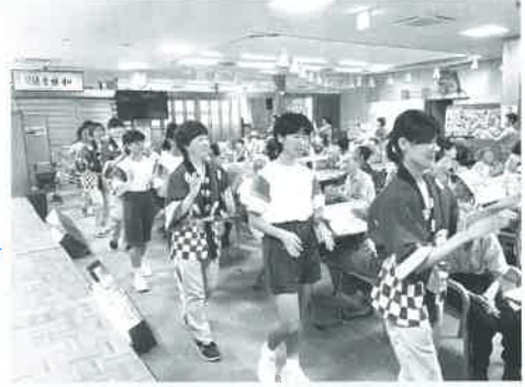
総盆踊りでは中学生ボランティアも踊りました!