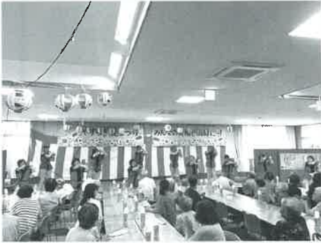
◀オープニングは、職員有志の銭太鼓!

8月17日(土)、デイサービスセンターやすらぎの夏まつりを行いました☆参加者は総勢で200名を超え、中学生など地域のボランティアさんもいろいろな場面で盛り上げてくれました!