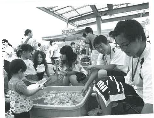
中学生や多可高校生など、100名近いボランティア が大活躍！