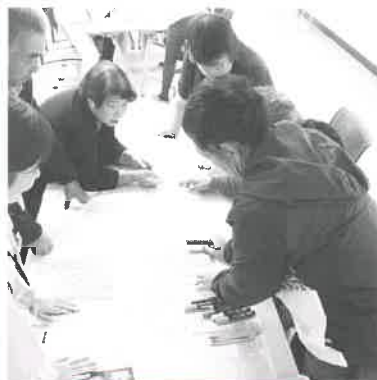
加美区奥豊部集落