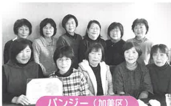
パンジー（加美区） グループ結成年度：平成20年度

3つのグループとも長年にわたって高齢者や障害者のための給食サービスの調理などのボランティア活動に取り組み、ボランティア研修会などの研修・交流の場にも積極的に参加をされています。