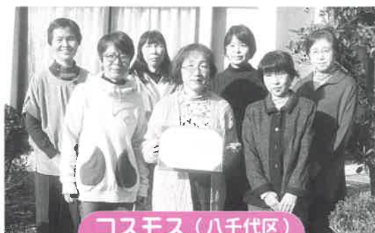
コスモス（八千代区） グループ結成年度：平成9年度