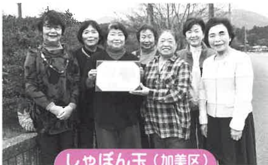
しゃぼん玉（加美区） グループ結成年度：平成19年度