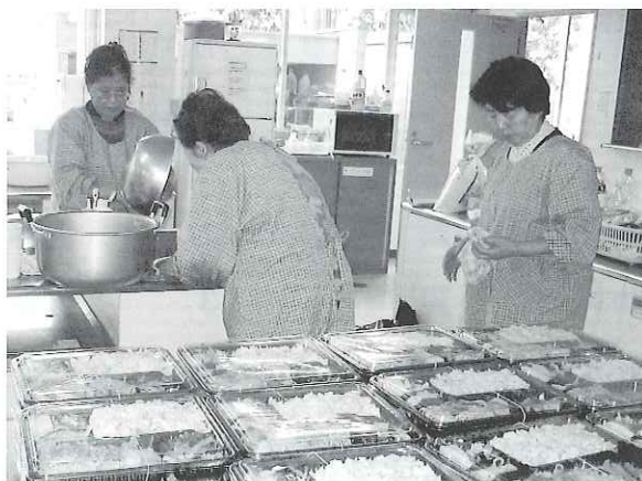
中区の給食サービスより

訪問介護、通所介護、訪問入浴介護、地域密着型認知症対応型共同生活介護の5つの介護保険サービスを提供し、質の向上をめざします。