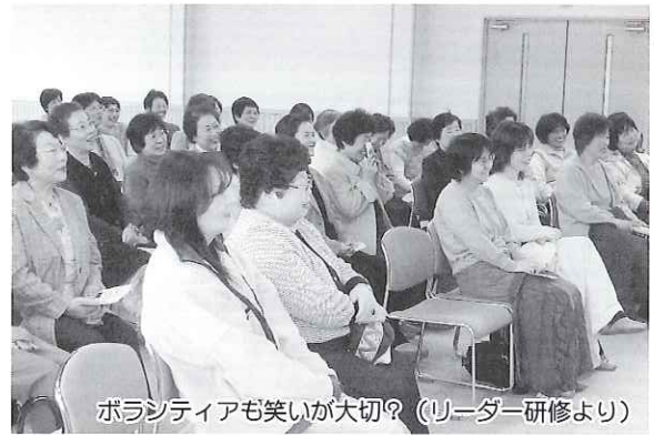
ボランティアも笑いが大切? (リーダー研修より)