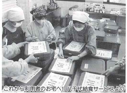
これから利用者のお宅へ! 八千代給食サービスより