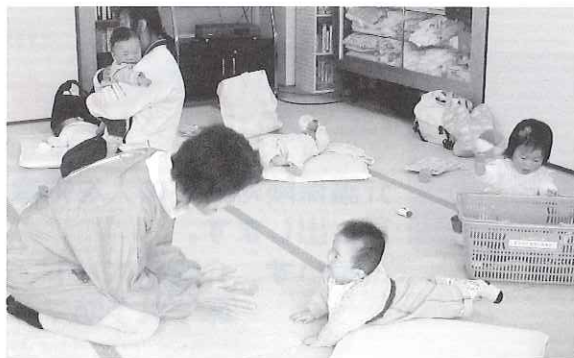
アスパルで託児ボランティア