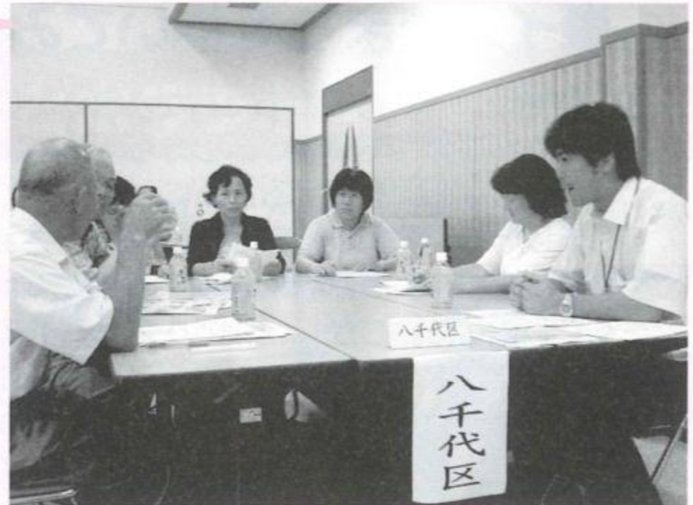
地域福祉推進委員会研修会資料抜粋

「地域福祉推進委員会」の役割は、主として支部エリアで地域福祉の推進を図る合意形成、ネットワーク形成、意識啓発（学習）の場であり、さまざまな住民層が、多様なアイデアを持ち寄って、福祉のまちづくり推進のための協議を行う場。