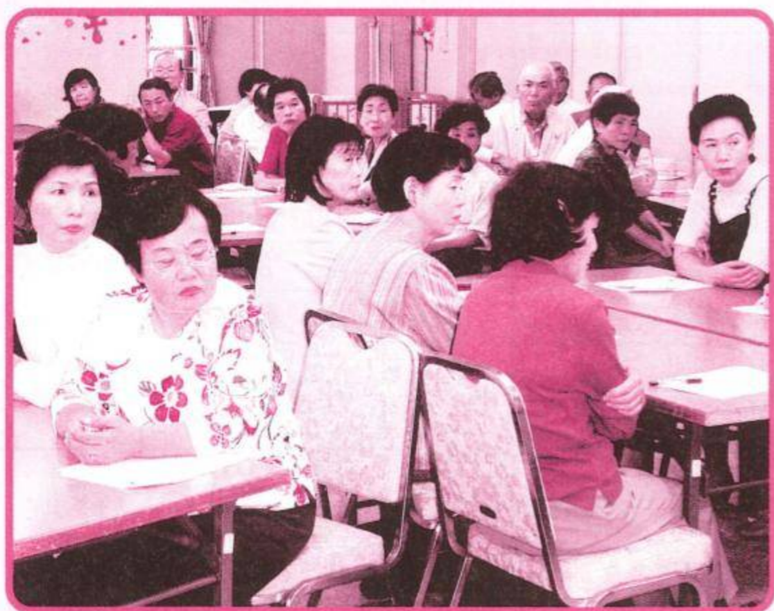
みなさんの熱心な