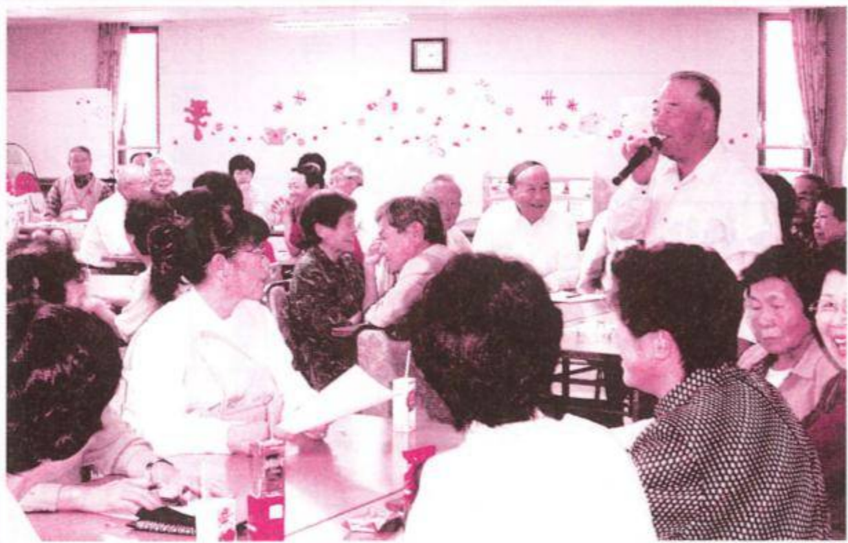
会場から質問も・・・

後半には、参加されたみなさんがそれぞれのグループごとに情報交換され和やかに話し合われていました。