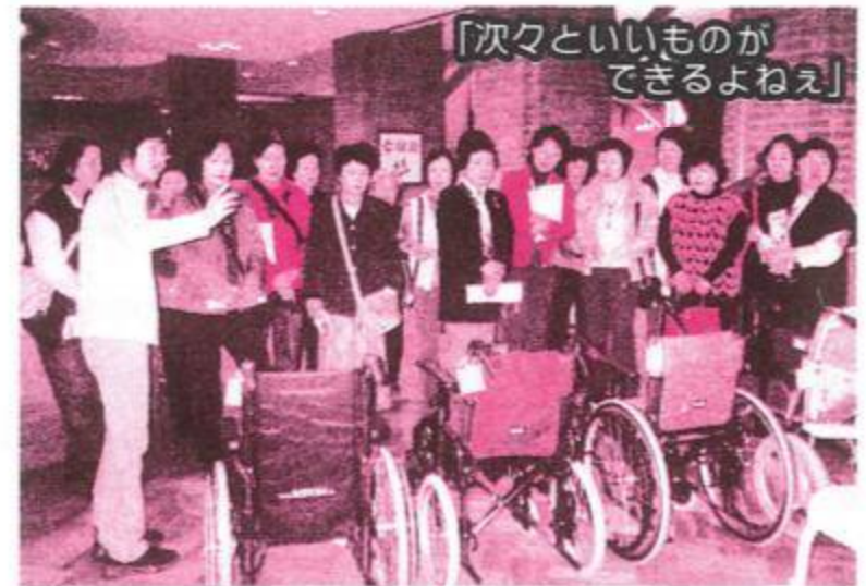
「県立西播磨総合リハビリテーションセンター見学」福祉用具の展示ホールにて職員から説明を受ける参加者の皆さん

今年で何回目になるのでしょうか？このように続いてきていることこそが、とても有意義な旅行企画であるという証しだと思います。関係者の皆さまに感謝申し上げます。