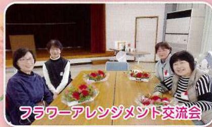
フラワーアレンジメント交流会