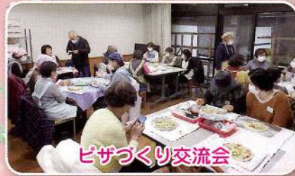
ピザづくり交流会