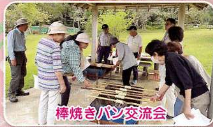
棒焼きパン交流会