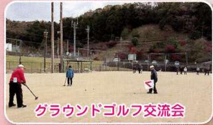
グラウンドゴルフ交流会