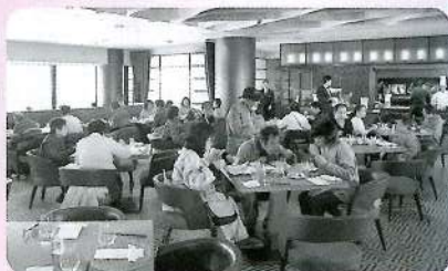
ハートフルツアー