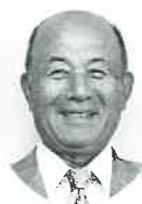
多可町社会福祉協議会会長