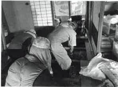
床下の泥出しをされているところです。

災害時では、特に、普段からの地域でのつながり、助け合いが必要だと感じます。災害にも強いまちづくりを目指して、普段から顔の見える関係、助け合える関係を作っていきたいですね。