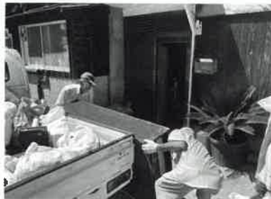
家具の運搬をされているところです。大変暑い中の屋外の活動でした。