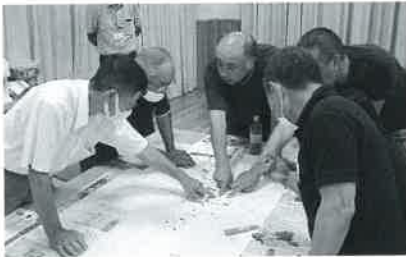
7月22日(土) 中安田集落

この数年、ふくし防災マップづくりに取り組まれる集落が増えており、更新に合わせて他の活動も実施される集落もあります。