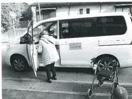
通院や買い物のための外出支援