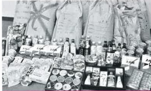
地域のみなさまから