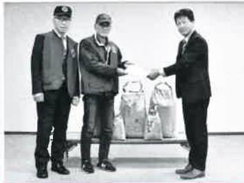
中ライオンズクラブ様 結成60周年記念事業

地域の方々、中ライオンズクラブ様、コープこうべ様からいただいた食品を、生活にお困りの方、51世帯109名にお渡ししました。（12月21日現在） みなさまから温かいご支援をいただき、本当にありがとうございました。