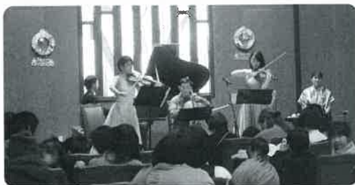
クリスマス親子コンサート