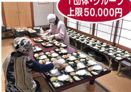
子ども食堂ココメグキッチン