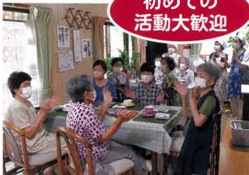
いこいの家「紫陽花」