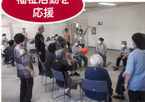
チームオレンジたか