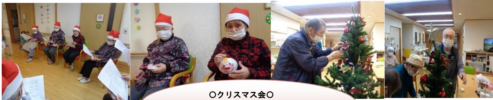
○クリスマス会○ 皆で楽しくゲームや歌を歌いました♪

朝晩と冷え込みも厳しいですが、やすらぎの郷では 2 名の新しい入居者様を迎え、にぎやかにお正月を祝うことができ喜んでます。今年も一年、みなさん健やかに笑顔の絶えない日々を過ごしていただけるよう職員一同頑張っていきます。