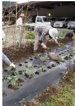
『おいしいさつまいもができますように』