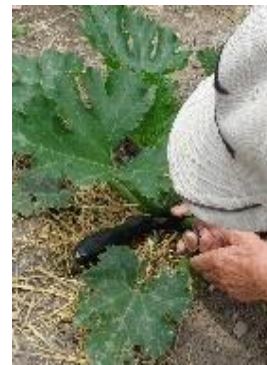
『初めての収穫です』