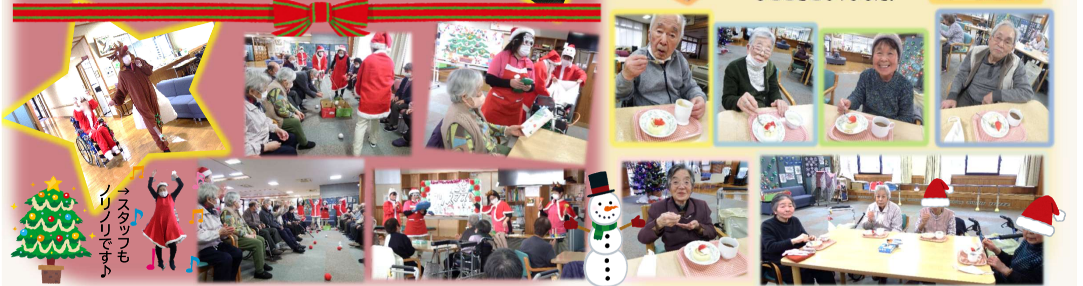
→スタッフもノリノリです♪

クリスマス会のおやつはケーキでした♪ 甘いケーキに、みなさん心もほっこり、笑顔あふれるひとときとなりました。