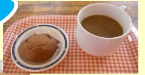
バレンタインに合わせて チョコレートのカップケーキ