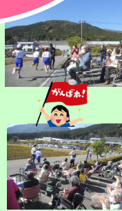
→杉原谷小学校マラソン大会 全員で応援がんばれ！