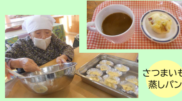
さつまいも 蒸しパン