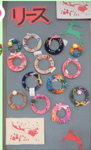
毛糸を巻き付けてカラフルに仕上がりしました ←クリスマスリース作り