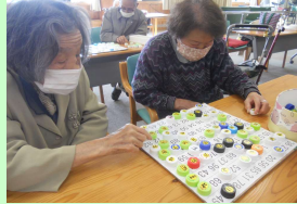
↑数字合わせ 1人でしたり、お友達やご夫婦で一緒に取り組まれています。1~100まであり、なかなか数字を見つけるのに苦戦します