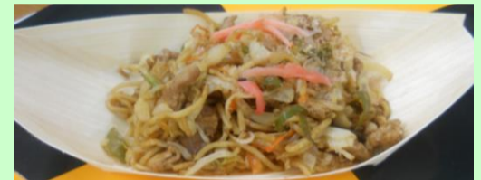
→器に盛り付け 出来上がり