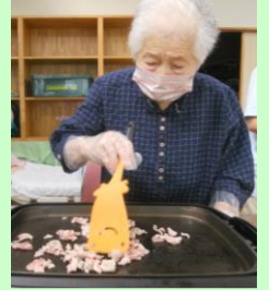
↑慣れた手つきで、手早く焼いておられました