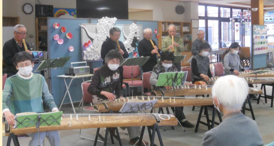
↑尺八グループ「竹の会」と琴グループ「竹の会」の演奏会。とてもきれいな音色にみなさんうっとり。