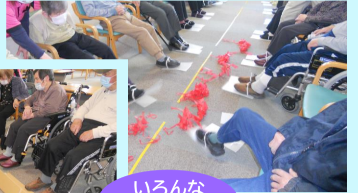
いろんな運動レク