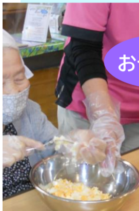
↑今回のおやつレクでは玉子サンドをお手伝い頂きました