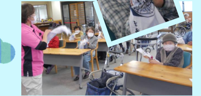
足で仰いでお花紙を相手陣地に送ります↓