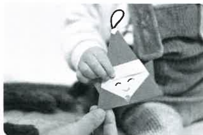
子育て応援クリスマスプレゼント