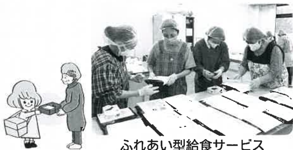
ふれあい型給食サービス

バス乗車体験会、買い物ツアー、ハートフルツアー、 子育て支援活動助成、子育て応援クリスマスプレゼント、 ふれあい型給食サービス、無料法律相談などの事業へ …… 1,090,167円