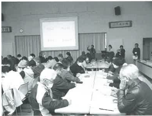
「りんご」「ちょっと」「ボール」「ちゃんと」の言葉を絵に描いてみよう!