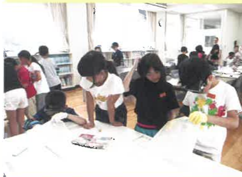
松井小学校 高齢者擬似体験