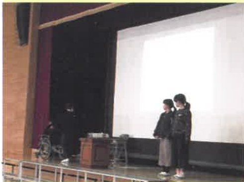
中町北小学校 体験教室