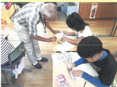
八千代小学校 点字体験

社協では、“みんなが安心して暮らせるまちづくり”を進めるため、福祉に関心を持ってもらい、ボランティア活動などへの理解やきっかけづくりの場として、町内の小学校やボランティアと一緒に福祉学習に取り組んでいます。