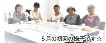
5月の初回の様子です☆