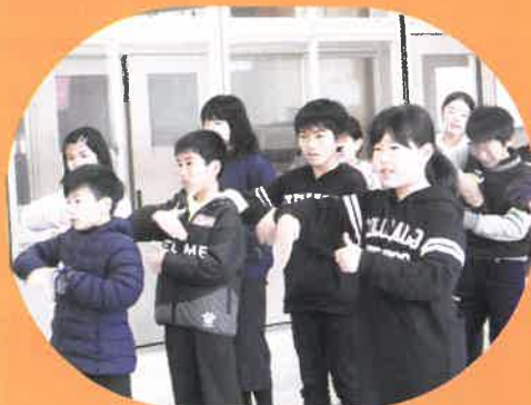
八千代小学校 手話歌学習

社協では、“みんなが安心して暮らせるまちづくり”を進めるため、福祉に関心を持ってもらい、ボランティア活動などへの理解やきっかけづくりの場として、町内の小学校やボランティアと一緒に福祉学習に取り組んでいます。