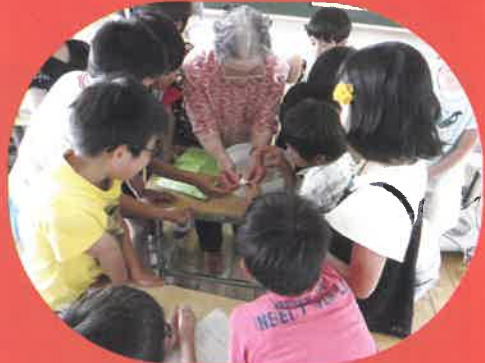
杉原谷小学校 ボランティア学習