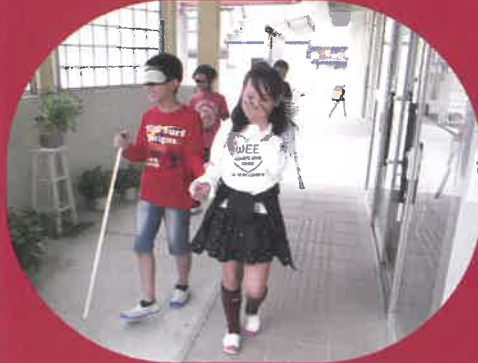
中町南小学校 アイマスク体験