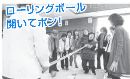
ローリングボール 開いてポン! ボールの種類によって転がり方も 違いました!

これからはますます高齢社会となり、地域でのボランティア活動が大切です。多可町のため、自分自身のためにも、健康な内にできること、喜んでもらえることをしていきましょう!