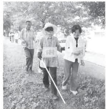
昨年度は加美コミュニティプラザ周辺で行いました。

お申し込み・お問い合わせは、 多可町社会福祉協議会各支部まで (中支部:32-3425 加美支部:30-8151 八千代支部:37-0360)