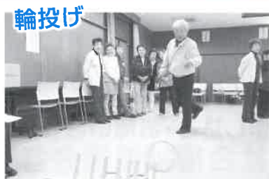
輪投げ 男性ボランティアさんの頑張りどき! かっこいい姿…見せられたかな?