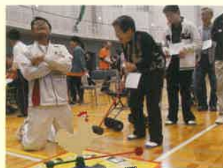
昨年度も盛り上がりました!