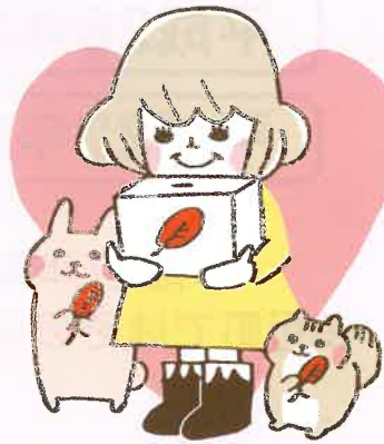
兵庫県協同募金会マスコットキャラクター あかはねちゃん

多可町で集まった募金は、翌年、約9割が多可町共同募金会に配分され、多可町内の福祉活動に役立てられます。残りの約1割は兵庫県内の福祉施設や福祉団体、ボランティア団体、NPO団体などへ配分されます。